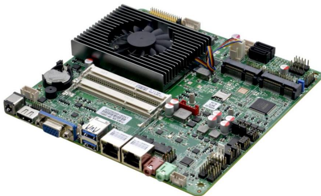
ITX-B670_I51226L VER:1.3 主板侧面图