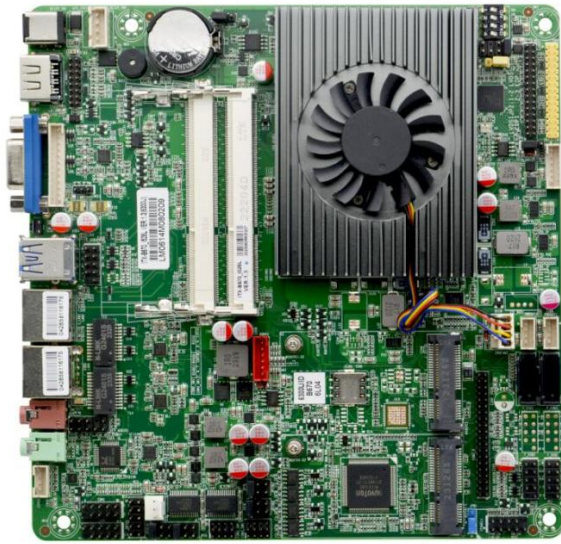
ITX-B670_I526L VER:1.3 主板正面图